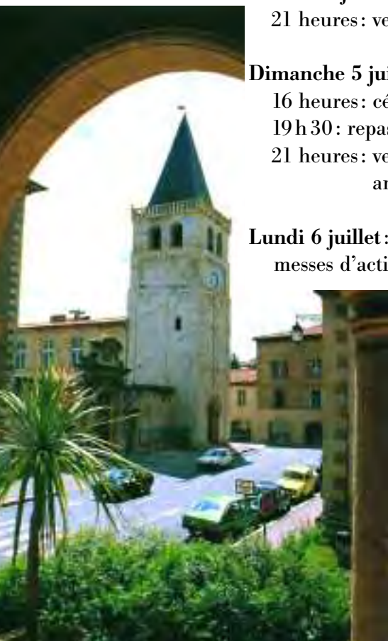
Clocher de la cathédrale Saint-Benoît de Castres

messes d'action de grâce en trois langues, espagnol, français et portugais.