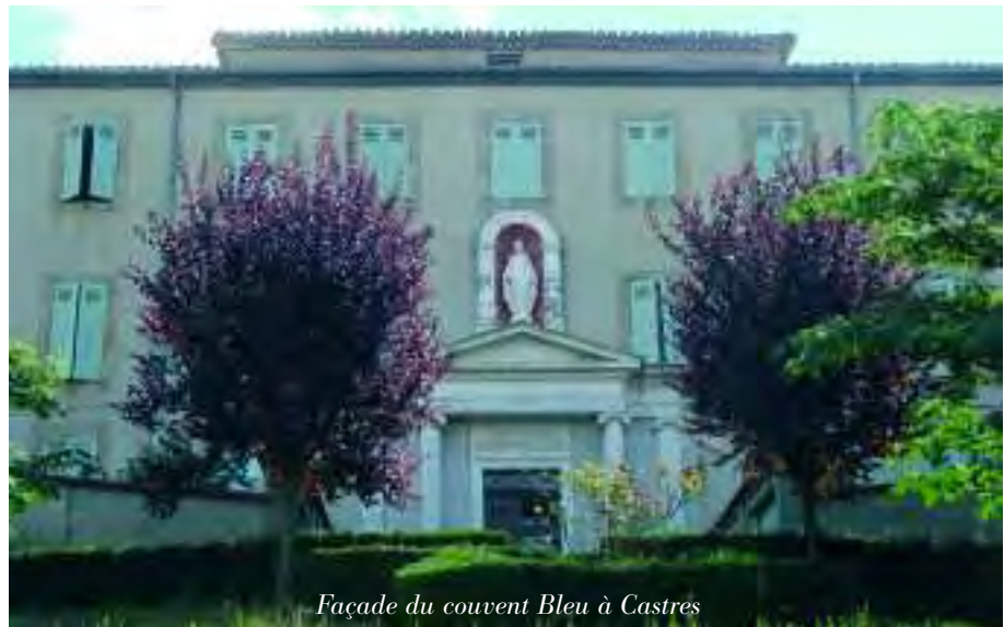
Façade du couvent Bleu à Castres