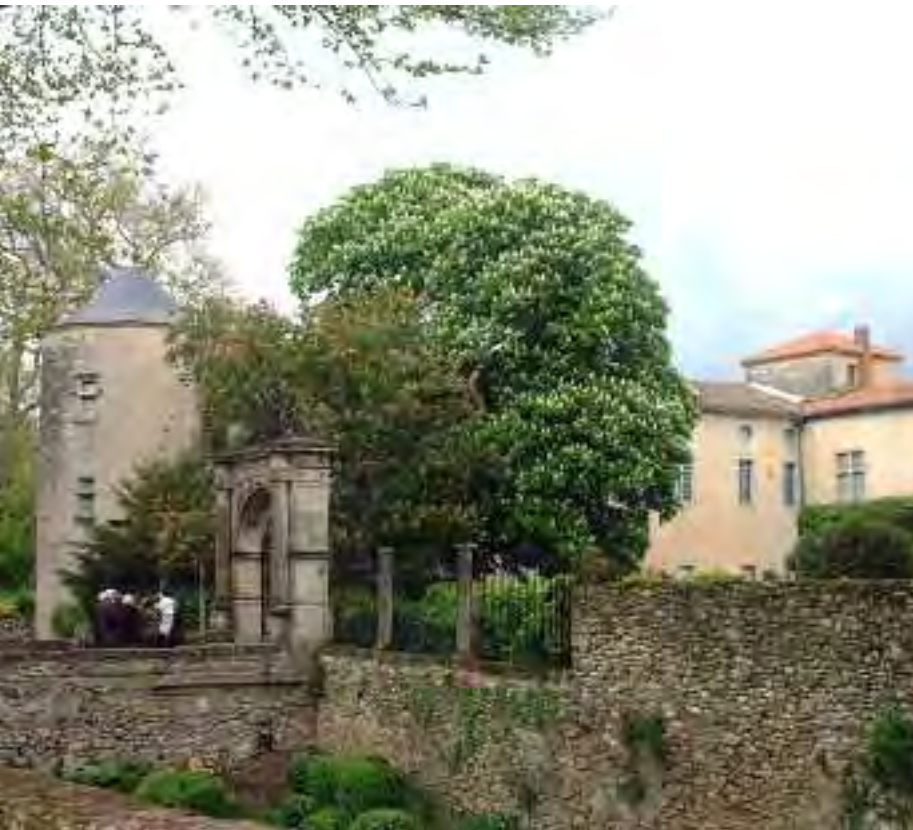
Château d'Hauterive, demeure familiale.